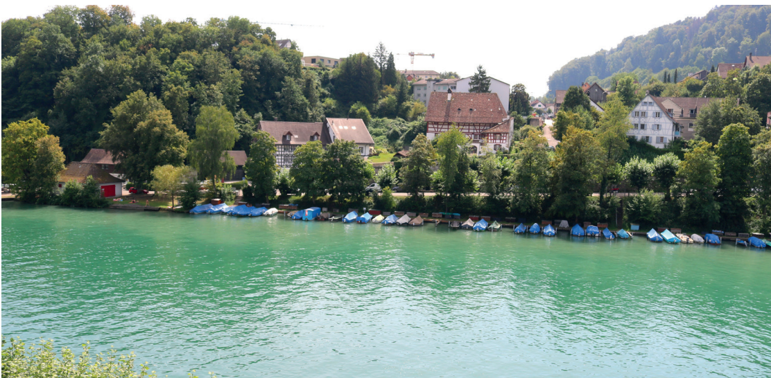
Aussicht von Terrasse